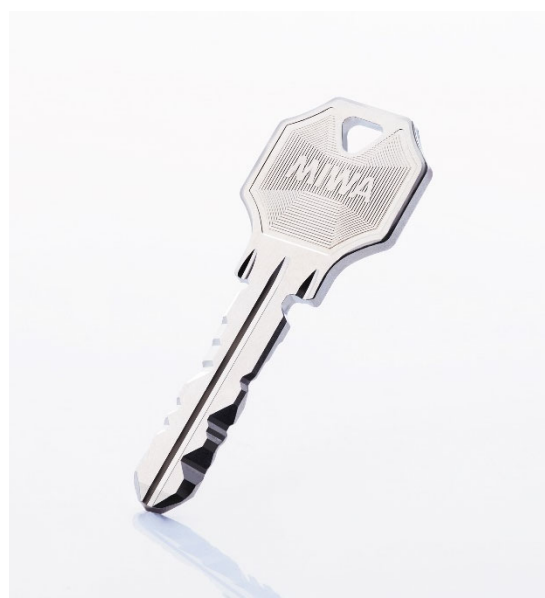
WR キーのリッジカット