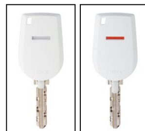
表示の色は橙色と白色です。