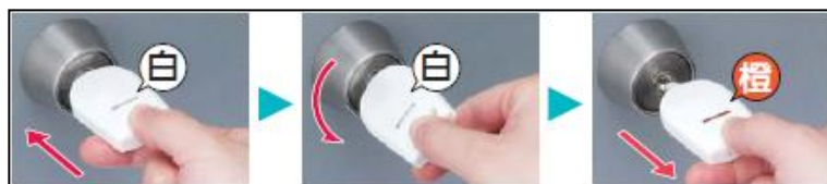
施錠すると表示窓の色が変わります。

当社標準キー(U9/UR/PR/PS)であれば特別な操作は不要で簡単に取り付け可能です。