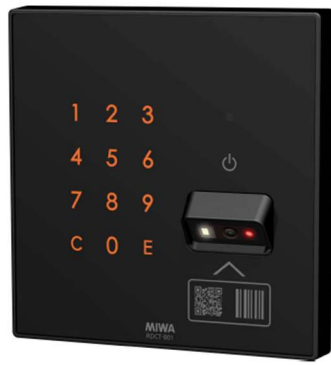
共用部用 コード・テンキーリーダー